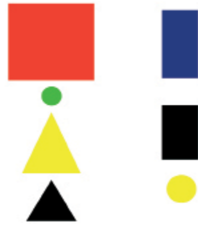
Étude pour l'Arbre panvocalo-coloriste ; Riverain du fleuve jaune portant l'habit vert , George Orrimbe, 2011