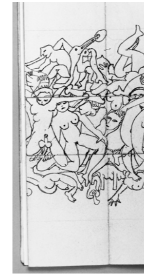
Orgie , Aline Gagnaire, Polyptykon, 1985 Un calcul fastidieux montre que l' Orgie comporte 1 281 positions...