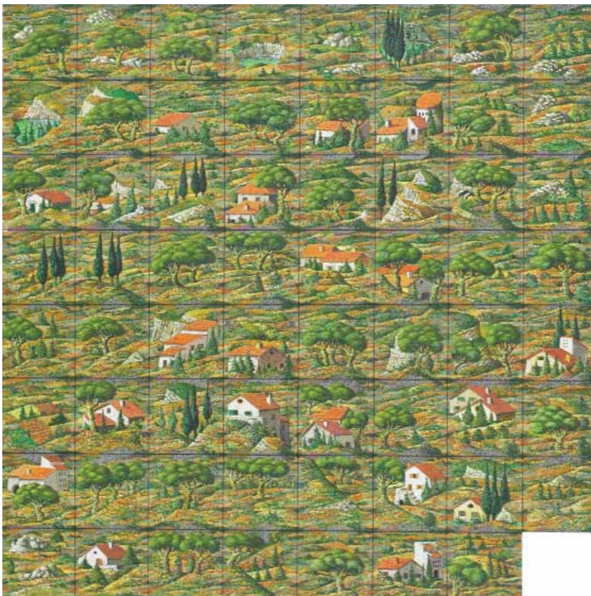
Paysage taquinoïde , Jacques Carelman, nouvelle version 2002

Tableau conçu de telle façon que le sujet représenté, par exemple un paysage, reste cohérent quelle que soit la position des carrés. Combinaisons possibles : 63 443 466 092 942 082 051 716 694 667 580 740 401 432 758 087 272 596 099 400 947 187 607 352 115 200 000 000 000 000