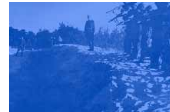
Réassemblance stéréoscopique 1 , Brian Reffin Smith, 2011 Choisissez une image au hasard. Trouvez, sans y penser, une autre qui d'une certaine manière lui "ressemble" avec un élément en commun. Mettez les deux ensemble, l'une rouge, l'autre cyan, comme une fausse image anaglyphique. Observez à travers des lunettes rouge/cyan, d'abord avec un oeil, puis l'autre.