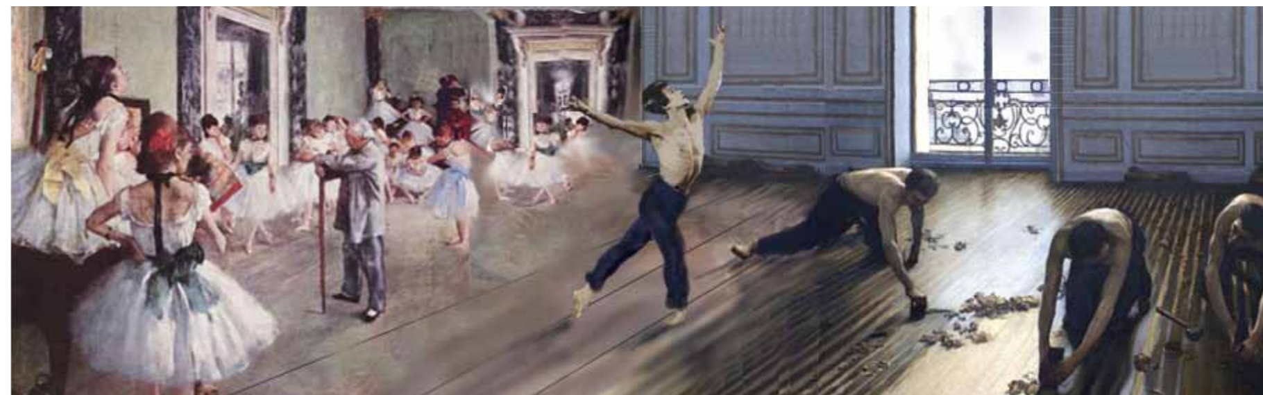
Degaillebotte , Philippe Mouchès Picturogenèse bitangentielle. Peindre un tableau pour qu'il constitue le "passage" entre deux autres...

Tableau conçu de telle façon que le sujet représenté, par exemple un paysage, reste cohérent quelle que soit la position des carrés. Combinaisons possibles : 63 443 466 092 942 082 051 716 694 667 580 740 401 432 758 087 272 596 099 400 947 187 607 352 115 200 000 000 000 000