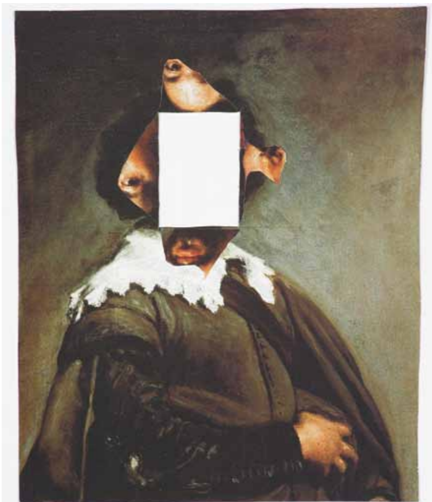
La Révélation du vide , Olivier O. Olivier avec Diego Velázquez, déchirement, 2000