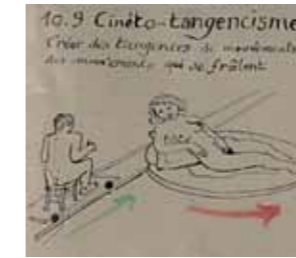
Les Cent Fleurs de l'Oupeinpo, Jacques Carelman et l'Oupeinpo, 1991 Exemples : Matério-matérisme ; Symétro-symétrisme ; Tango-cinétisme (mouvoir par tangence) ; Cinéto-tangencisme (créer des tangences de mouvements, des mouvements qui se frôlent)...