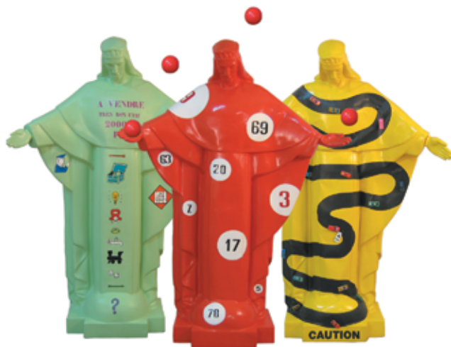
Elisa FANTOZZI Les corcovados H: 2 m Moulage tirage en résine