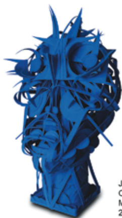
J-C BELAUD Océanos Moquette, 115 x 66 x 70 cm 2011