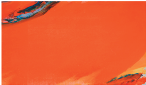
Olivier Debré - Rouge oblique de Loire - 1952 Huile sur toile 180x310cm - Collection particulière

Durant l'été, du 28 juin au 28 septembre, le Musée des Beaux-Arts de Carcas- sonne propose un triple regard sur l'œuvre d'Olivier Debré.