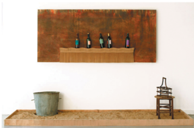
Jack VANARSKY Les Demoiselles font leur chemin - 2003 - Installation Médium, bouteilles, mécanisme électrique, porte-bouteilles, tabouret, seau, panneau.. 347x 80 x10 cm