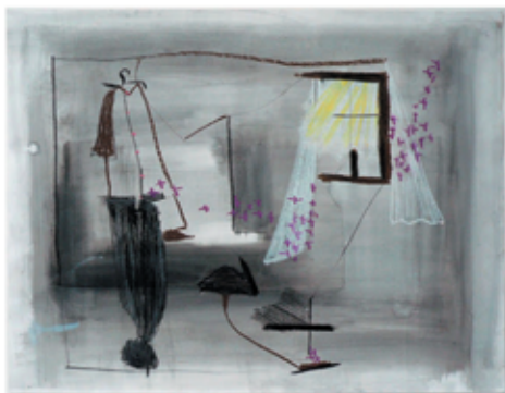
Sophie Licata-Carusso, Acte 1 Scène 1 Visite incongrue 2012, 49 x 64 cm. Dessin Techniques mixtes

Mon intérêt se porte sur les objets du quotidien, omniprésents et dont nous aurions du mal à nous passer ; sur le papier Je m'amuse à dissocier leurs formes, leurs matières, leurs couleurs, leurs dimensions(...), puis je rétablis des liens par un jeu de lignes, de circulations, d'attaches ... afin de recréer des tensions chargées en émotions. Aujourd'hui, je suis attirée à nouveau par le monde des coulisses de la scène, un champ d'exploration qui m'inspire.